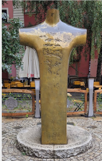
Replik des 1989 gegossenen Bronzetorsos vor der Elisabethkirche in Bonhoeffers Geburtsstadt Breslau.

Was aus Bonhoeffers Leben, Wirken, Denken, Beten, Kämpfen, Leiden spricht noch zu uns Heutigen? Welche Impulse seiner „unfertigen Theologie“ provozieren und inspirieren (Christen) Menschen in der Postmoderne?